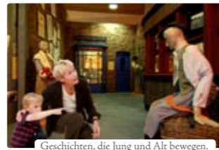
Geschichten, die Jung und Alt bewegen.

Die BallinStadt ist ein Erlebnis für Jung und Alt, für die ganze Familie. Zum Staunen, zum Erleben und sich berühren lassen von Menschen, für die vor über 100 Jahren Hamburg ein Hafen der Träume war.