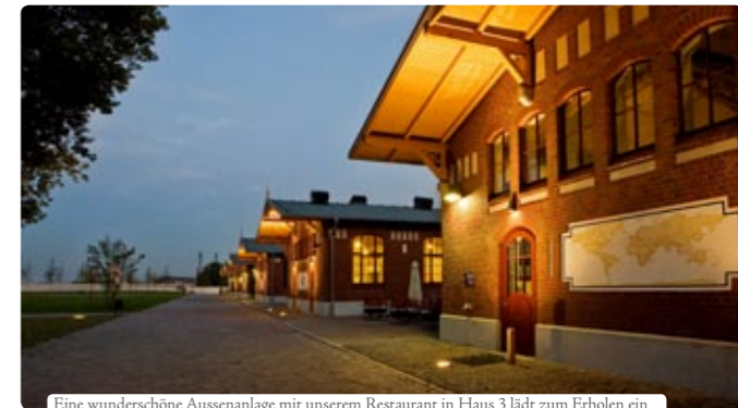
Eine wunderschöne Aussenanlage mit unserem Restaurant in Haus 3 lädt zum Erholen ein

Die BallinStadt ist ein Ort, der die Brücke schlägt zwischen Vergangenheit, Gegenwart und Zukunft. Er ist gelebte Erinnerung für alle Generationen von Besuchern - ein Ort, der Sie fesseln wird.