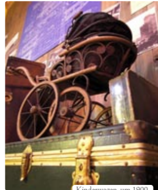
Kinderwagen, um 1900

Die BallinStadt ist ein Ort, der Geschichten erzählt. Geschichten von Menschen, die aufgebrochen sind, ihr Glück in der Neuen Welt zu suchen.