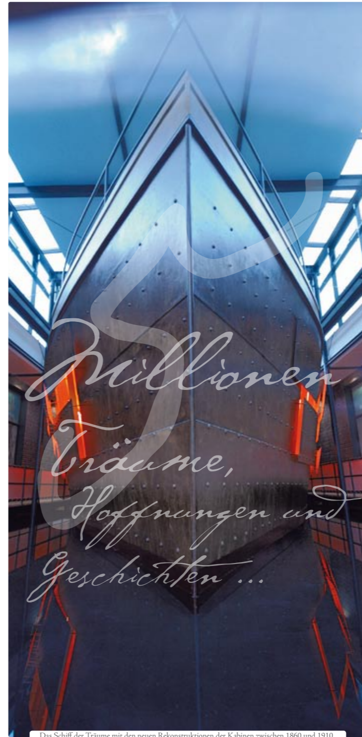
Das Schiff der Träume mit den neuen Rekonstruktionen der Kabinen zwischen 1860 und 1910.