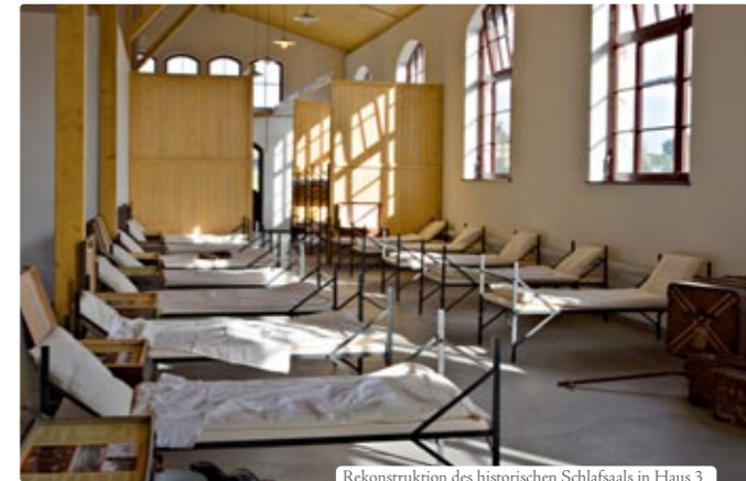
Rekonstruktion des historischen Schlafsaals in Haus 3

Das preisgekrönte Konzept der BallinStadt lässt die Welt der Auswanderer wieder auferstehen. Mit Hilfe modernster Ausstellungstechnik entsteht in lebendigen Bildern eine Welt, die Ihnen die Menschen und ihre Herausforderungen näher bringt.