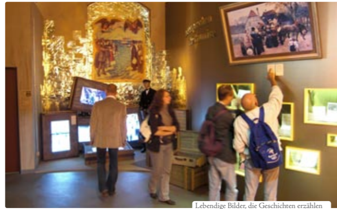
Lebendige Bilder, die Geschichten erzählen

In diesem Gebäude befinden sich auch das Restaurant und der Shop.