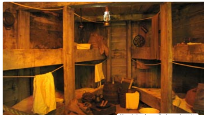
Unterdeck auf einem Frachtensegler 1860

In lebendigen Bildern erstet die Geschichte der Auswanderung über Hamburg wieder auf - und berührt jeden Menschen, der Träume hat. Lassen Sie sich berühren von über 1200 historischen Exponaten aus der Zeit zwischen 1850 und 1930, die das Leben der Auswanderer begleitet haben.